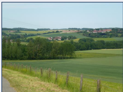
Schéma d'Aménagement et de Gestion des Eaux des Deux Morin