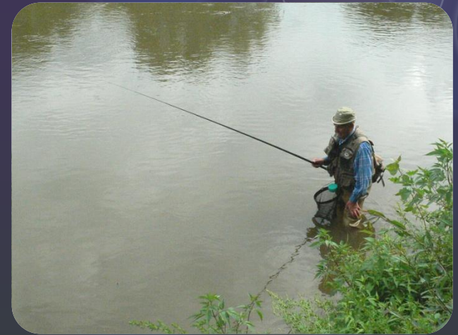
Pêche de la friture en moyenne et basse Azergues