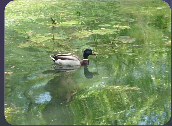
Le canard colvert, principal gibier d'eau chassé

Le chasse du gibier d'eau est dans le bassin versant plus une chasse d'opportunité qu'une chasse spécialisée