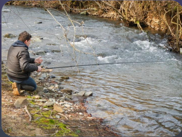
Pêche de la truite en haute et moyenne Azergues, sur le Soanan et dans les ruisseaux