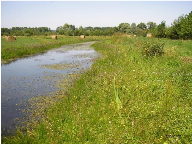
Figure 2 – Bordure de canal dans le marais noir de St Coulban

mise en place à partir de 2018 par mise en défens des périmètres des parcelles. Les clôtures ont été espacées des haies ou des limites cadastrales d'un mètre, des canaux de 5 mètres et des fossés de 2 mètres (Figure 2).