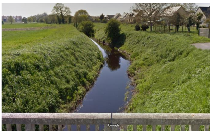
Figure 1 – Le Meleuc en aval du marais en avril 2018.

Inclut dans les vastes marais de Dol (10 500 ha), le Marais Noire de Saint-Coulban est une dépression régulièrement inondée constituée d'anciens dépôts ligneux formant un sol tourbeux et juxtaposant la baie du Mont-Saint-Michel. Il incluait jusqu'en 1950 environ une surface en eau résiduelle (la Mare de St-Coulban), avant que celle-ci ne soit asséchée 1 . Le marais est principalement alimenté par le Meleuc, qui montre un fort recalibrage (Figure 1).