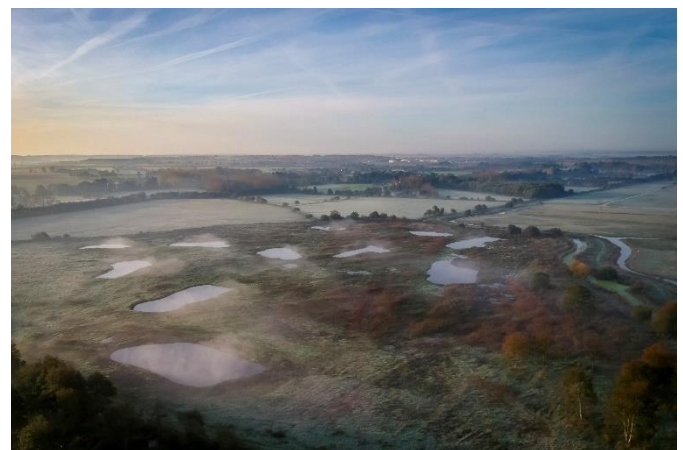
Figure 3 – Marais noir de Saint Coulban après les travaux.

Pour la FDC35, le projet est une réussite sachant que le marais a été restauré à partir de champs de maïs. Désormais, l'utilisation agricole des parcelles est possible 4 mois. Il est impossible l'autre partie de l'année compte tenu de l'inondation et de la période de ressuyage.