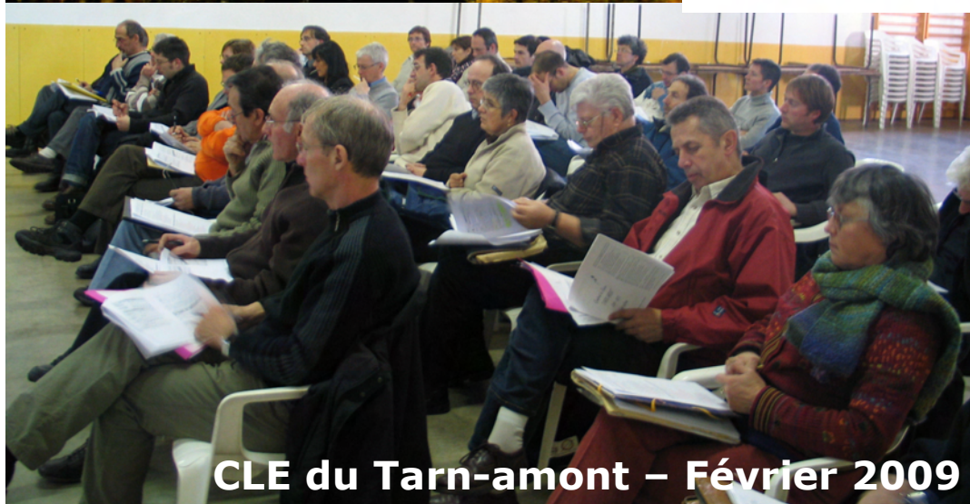
CLE du Tarn-amont – Février 2009