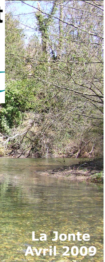
La Jonte Avril 2009