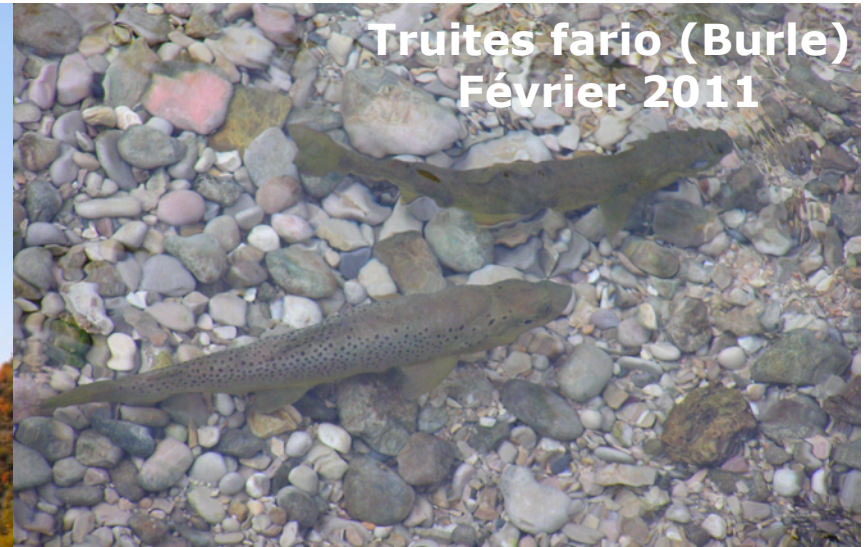
Truites fario (Burle) Février 2011