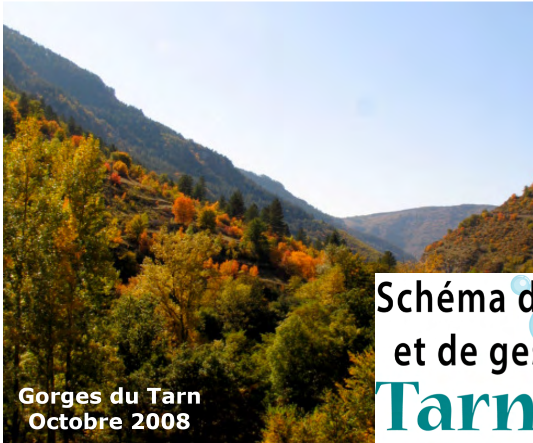
Gorges du Tarn Octobre 2008