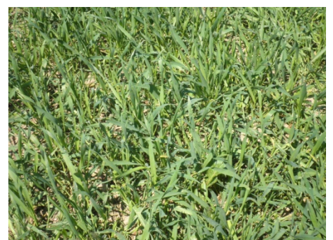
Triticale le 24 avril 2013