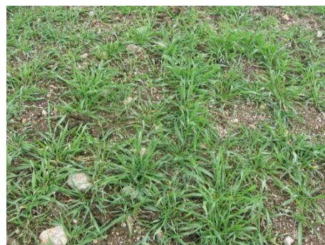
Triticale le 5 avril 2013

Espèce : Mélange prairial multi espèces (graminées et légumineuses)