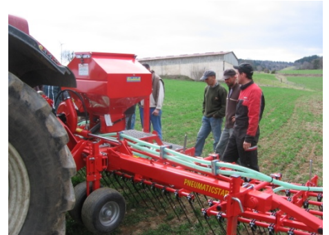
Second réglage pour affiner le travail de la herse (Lérigneux).