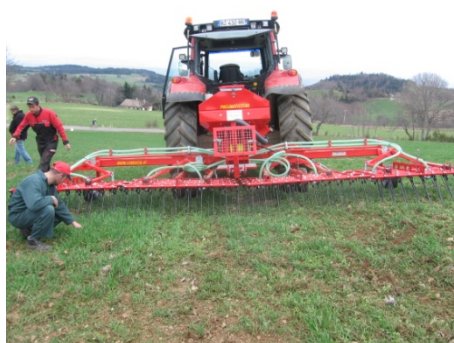
Observation du résultat du travail des dents et de la qualité du semis.