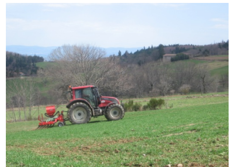
La herse offre de la souplesse d'utilisation sur des sols légèrement en pente.