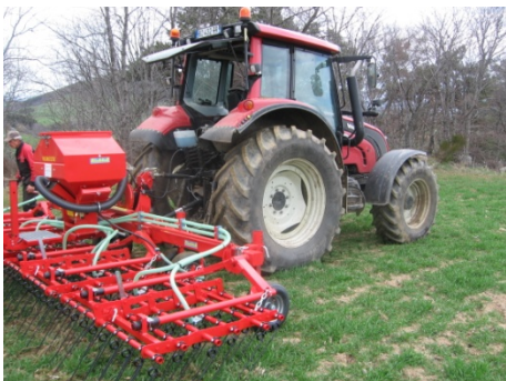
Premier passage de l'outil après les deux réglages (Lérigneux).