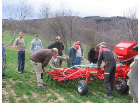
Réglage de l'agressivité des dents étrilles de la herse (Lérigneux).