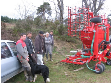
Réception de la machine avec la CUMA des Monts de Rochefort

La CUMA de la Trézaillette et la CUMA des Monts de Rochefort ont procédé aux premiers essais avec une herse étrille doté d'un semoir pneumatique intégré. Les essais ont porté sur un semis de prairie sous couvert de céréales. Le principe est donc d'implanter une prairie dans la céréale. Cet itinéraire technique a pour but d'une part de supprimer le désherbage chimique de la céréale et d'autre part de favoriser une meilleure implantation de la prairie compte-tenu de la présence de légumineuses dans le mélange prairial utilisé ; les légumineuses sont réputées pour avoir une meilleure implantation au printemps qu'à l'automne. Ce choix de conduite technique permettra également une pâture d'automne qui stimulera la prairie pour une meilleure reprise au printemps suivant.