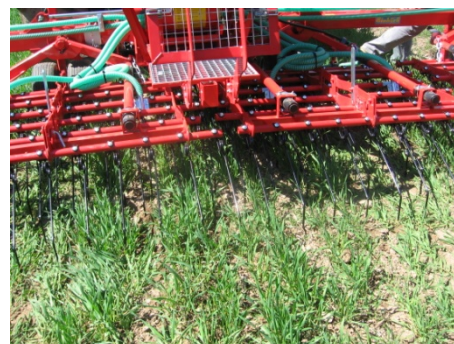
Passage de la herse le 17 avril 2013