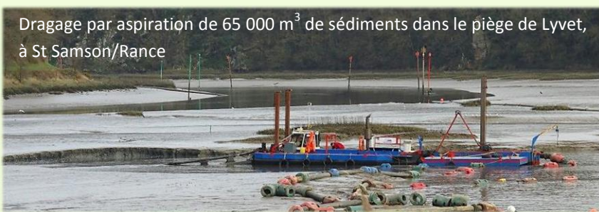
Dragage par aspiration de 65 000 m 3 de sédiments dans le piège de Lyvet, à St Samson/Rance