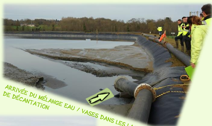
Visite du centre de transit des sédiments à La Hisse