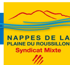
Schéma d'Aménagement et de Gestion des Eaux des nappes de la plaine du Roussillon