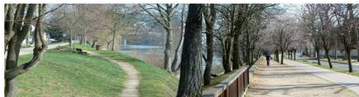
aménagements de berges de la rive droite en promenade, St-Maur-des-fossés