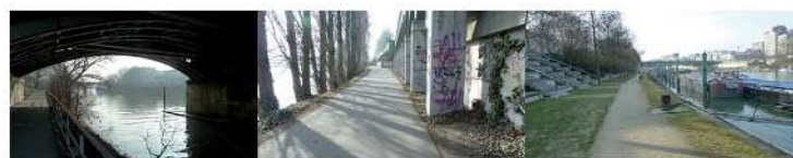
rive droite, au niveau de Charenton rive droite, au niveau de Saint-Maurice rive gauche, les berges de Maisons-Alfort