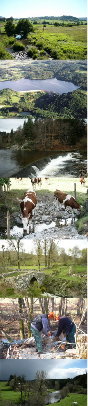
Schéma d'Aménagement et de Gestion des Eaux (SAGE) du Lignon du Velay

Projet de Contrat Territorial Lignon du Velay