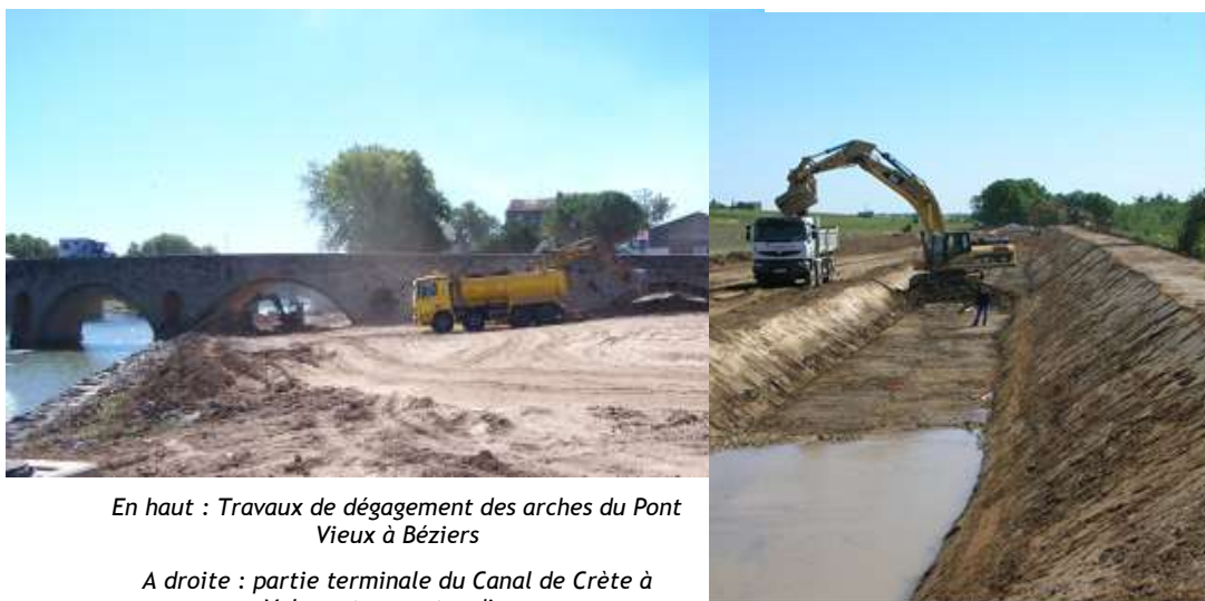
En haut : Travaux de dégagement des arches du Pont Vieux à Béziers

La commune de Béziers ayant renoncé à l'endiguement du quartier du Faubourg, une première tranche de travaux d'amélioration de l'hydraulique a vu le jour, le dégagement des arches du Pont Vieux.