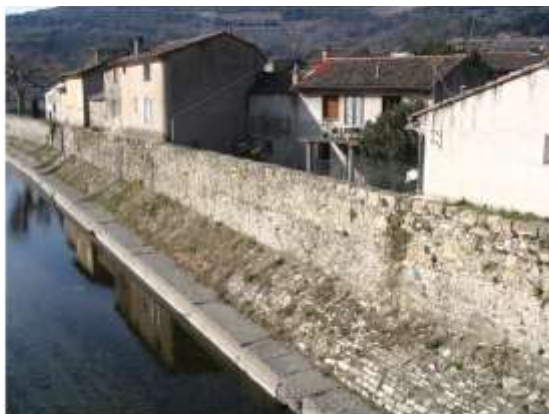
Le rempart de Villemagne l'Argentière le long de la Mare

Les ouvrages de protection existants ont fait l'objet de diagnostic et de travaux de confortement (Le Poujol sur Orb, Villemagne l'Argentière, Bédarieux, Saint Chinian, Plaine Saint Pierre).