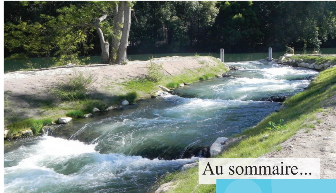
Dispositif de franchissement à Gademoulin (Charente)

Cet effectif est similaire à 2012 (332) mais nettement inférieur à 2010 (3 663). L'explication peut être apportée par les conditions hydro