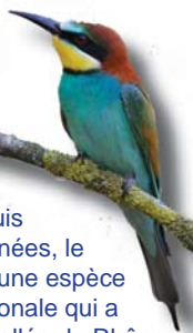
Hôte des berges de l'Ain depuis quelques années, le Guepier est une espèce plutôt méridionale qui a remonté la vallée du Rhône.

Au début des années 1970, elle n'était présente que sur la façade atlantique et très ponctuellement dans la bassin de Loire. Depuis, elle a recolonisé presque tous les affluents de la Loire et "attaque" par l'Est le bassin du Rhône.