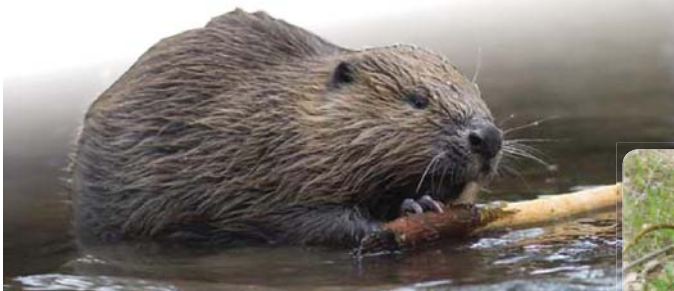
Le Castor pèse environ 20Kg avec un record établi à ce jour à 38Kg, qui dit mieux ?

Le castor (ou "Bièvre") a aussi laissé des traces sur les noms de cours d'eau. Ainsi, le Brévon, la Brévenne, la Bièvre, ... témoigne de la présence ancienne du castor.