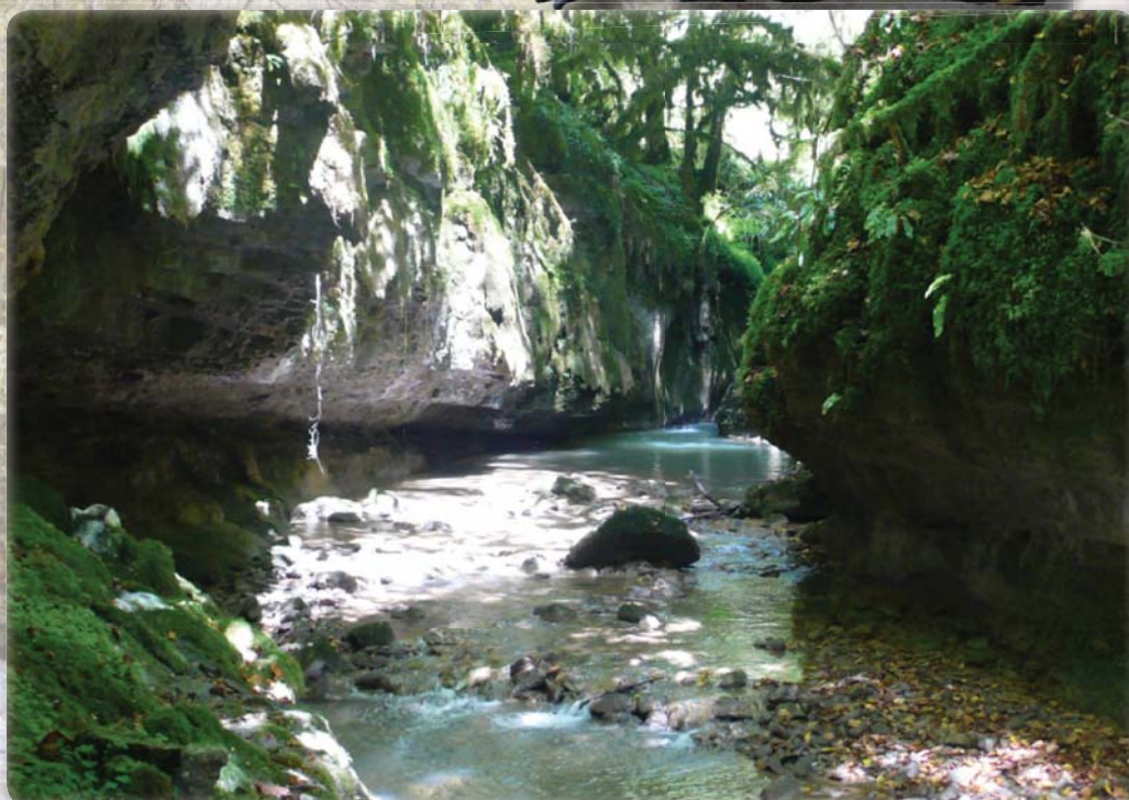
Les Gorges de la Mandorne à Oncieu, un désert apparent qui fourmille de vie