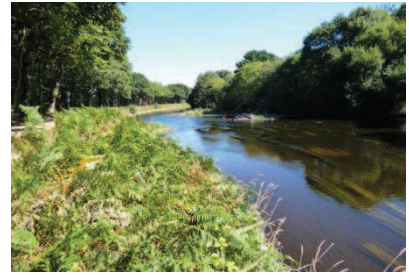
Schéma d'Aménagement et de Gestion des Eaux