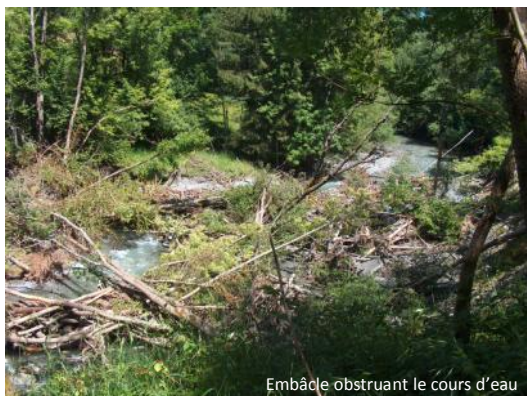
Embâcle obstruant le cours d'eau

Les propriétaires peuvent s'acquitter seuls de ces tâches ou se regrouper en associations syndicales.