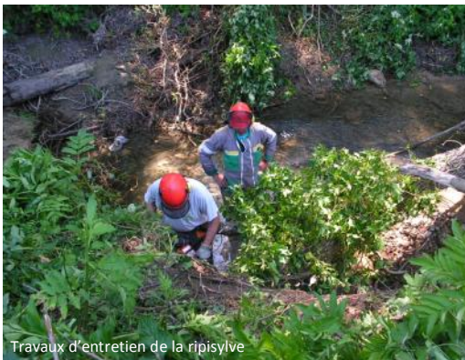
Travaux d'entretien de la ripisylve

L'exercice du droit d'usage de l'eau ne doit pas aller à l'encontre du fonctionnement naturel des cours d'eau. Le débit réservé doit être respecté.