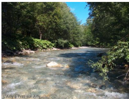
L'Arly à Praz sur Arly

Le propriétaire ne possède pas l'eau, mais dispose d'un droit d'usage limité à des fins domestiques, agricoles (arrosage, abreuvement), à condition de respecter un débit minimum pour l'équilibre des cours d'eau.