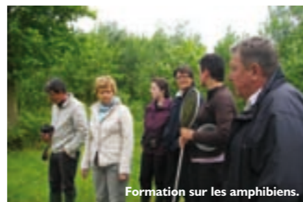
Formation sur les amphibiens.

Chaque année, le Parc et l'Éducation nationale accompagnent également, sur mesure, des projets scolaires d'éducation