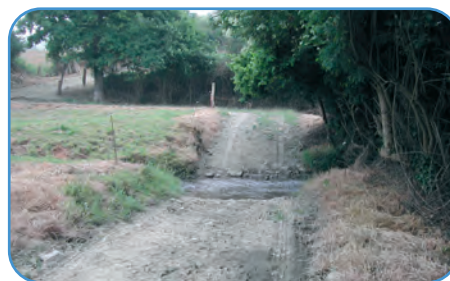
Allée traversée par un ruisseau et source traitées chimiquement à une distance non réglementaire.