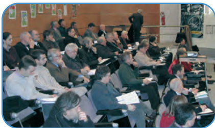
25 janvier : la CLE a désigné ses représentants

les riverains, les associations de pêche et de protection de l'environnement ainsi que les représentants des professionnels (artisans, agriculteurs, conchyliculteurs, producteurs hydro-électricité...).