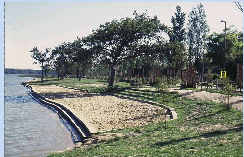
Aménagement abords Aureilhan