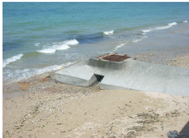
Emissaire pluvial sur la plage (I.I.B.O. - 2010)

Une fois les problèmes identifiés, l'ensemble des acteurs concernés pourra mettre en œuvre les solutions d'amélioration issues de l'étude, telles que :