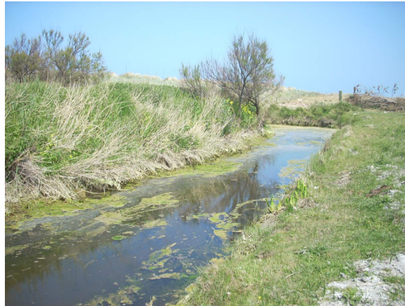
La Gronde dans le marais de Meuvaines (I.I.B.O. - 2010)

Les sources de pollution peuvent être multiples et leurs origines géographiques variées, depuis l'amont jusqu'à l'aval du bassin. Elles concernent donc à la fois les activités humaines et l'assainissement des communes littorales mais plus largement celles des communes de l'arrière pays littoral situées plus en amont sur le bassin (voir liste page ci-contre), et la pollution diffuse provenant des élevages. La contribution de ces communes en termes de pollution peut parfois être identique voire supérieure à celle des villes côtières.