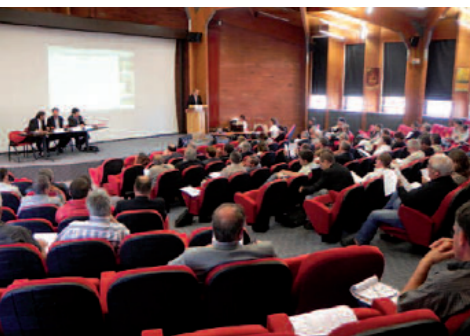
Réunion d'installation de la CLE - 20/06/2011

*Date butoir des retours sur le rapport (remarques et compléments) : 20 janvier 2012 - Poursuite des entretiens avec les acteurs : janvier 2012