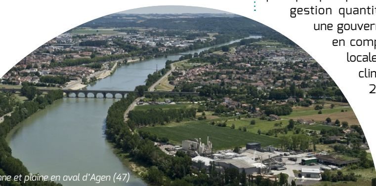
Garonne et plaine en aval d'Agen (47)

Dès lors, le projet se poursuivra entre avril et septembre avec une concertation des groupes thématiques qui aboutira à un Bureau de la CLE, afin de formaliser un projet de stratégie préalable à la rédaction du SAGE.