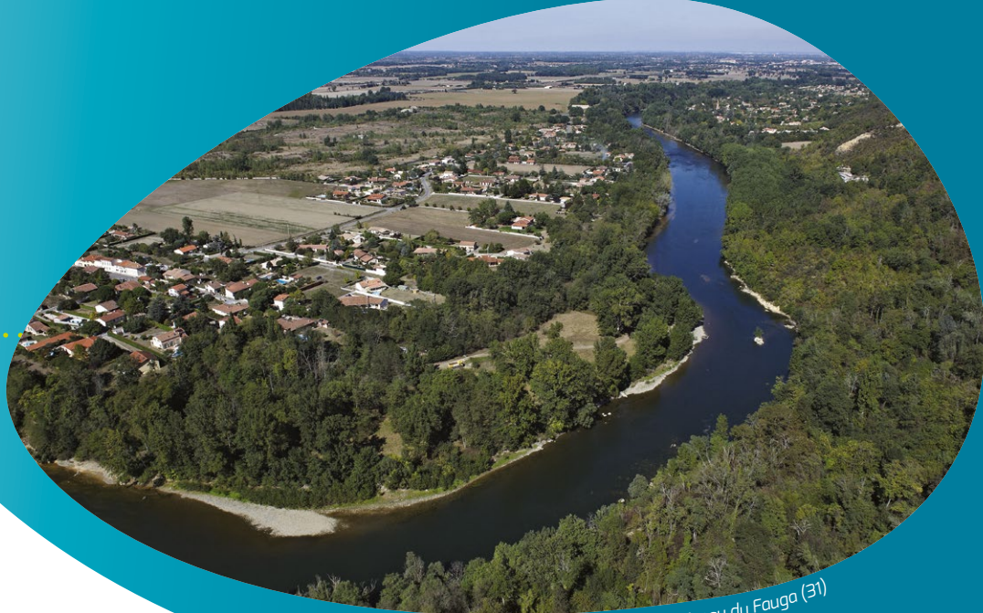
Garonne et plaine au niveau du Fauga (31)