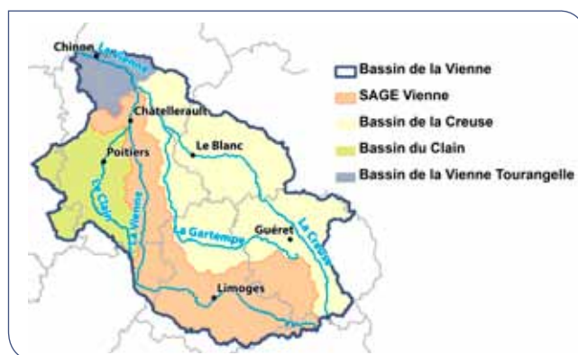
Territoire du SAGE Vienne

Le périmètre du SAGE Vienne s'étend sur une superficie de 7 060 km 2 depuis les sources de la Vienne sur le plateau de Millevaches jusqu'à la confluence avec la Creuse (le bassin du Clain étant exclu).