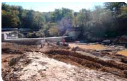
Travaux de démolition du barrage 29/09/17

Les travaux d'une durée de 6 mois (mai - octobre 2017), ont été menés sous la direction du Syndicat d'Aménagement du Bassin de la Vienne (SABV) pour un coût de 1.500.000 euros subventionné par l'agence de l'eau Loire-Bretagne et la Région Nouvelle-Aquitaine. Ce projet s'inscrit dans le cadre du contrat territorial milieux aquatiques «Vienne médiane et ses affluents» et permet de redonner à la Glane son cours naturel.