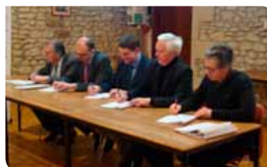
Le PAPI Vienne aval a été signé le 8 février 2018 à Cenon-sur-Vienne

Le montant total, estimé à 1,125 million d'euros réparti sur 3 ans, est financé à hauteur de 83% par les Fonds de Prévention des Risques Naturels Majeurs (FPNRM) aussi appelés « Fonds Barnier » et les fonds européens (au titre du FEDER Plan Loire) et à 17% par les collectivités territoriales et leurs groupements.