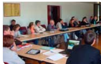
Réunion du Comité de l'eau le 4 mai 2018

Le SAGE Clain est actuellement en phase d'achèvement d'élaboration. Les documents constitutifs du SAGE (Plan d'Aménagement et de Gestion Durable de la ressource en eau et des milieux aquatiques et règlement) sont en cours de rédaction. L'objectif pour la fin de l'année 2018 est de présenter le projet de SAGE Clain à la CLE pour validation afin d'engager ensuite la procédure de consultation.