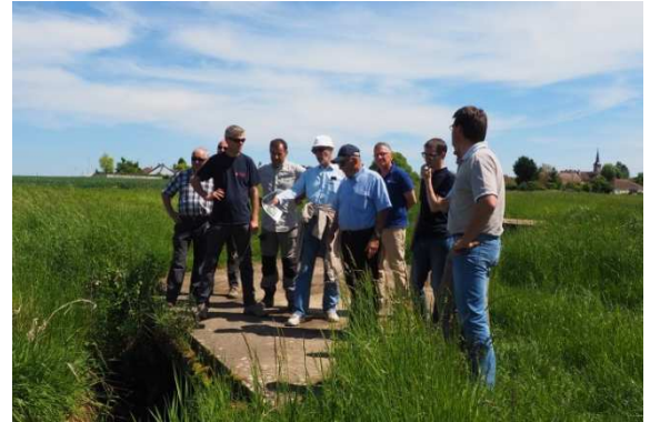
Visite sur l'Albane en mai 2017

plusieurs réunions en salle et sur le terrain ont été organisées en 2016 et en 2017.