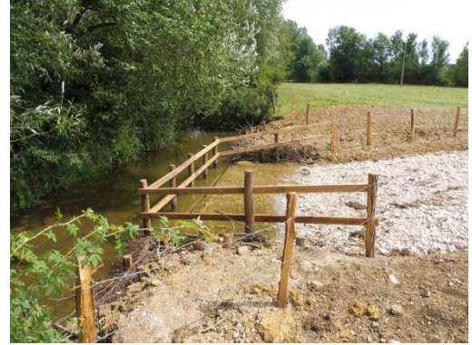
Un abreuvoir tout neuf !

L'élevage sur le bassin de la Vouge a presque entièrement disparu et les abreuvoirs qui longeaient les rivières avec. Néanmoins ici ou là il en subsiste. Après plusieurs échanges avec M NAIGEON, locataire d'une prairie le long de la Vouge à Villebichot, où se situaient 3 « prises d'eau », le SBV est intervenu afin de sécuriser 2 d'entre eux et de réhabiliter le 3 ème .