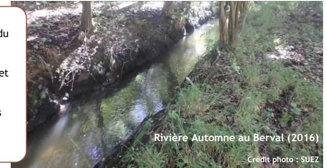
Rivière Automne au Berval (2016)