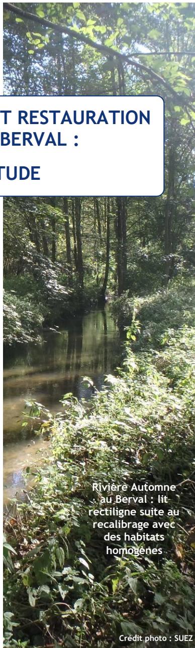
Rivière Automne au Berval : lit rectiligne suite au recalibrage avec des habitats homogènes

Le fond et les berges appartiennent aux propriétaires riverains.