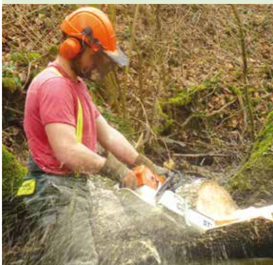
Jusqu'en 2022, il est prévu d'entretenir et de restaurer annuellement 20 km de berges.

Tous les 6 ans, le SMAGGA établit un plan de gestion pour l'entretien des 260 km de berges du Garon et de ses affluents. La quasi totalité des parcelles jouxtant la rivière étant situées sur le domaine privé, il est nécessaire d'établir des conventions avec les propriétaires pour que le SMAGGA puisse intervenir sur l'ensemble des berges des rivières de façon coordonnée, et non morcelée.