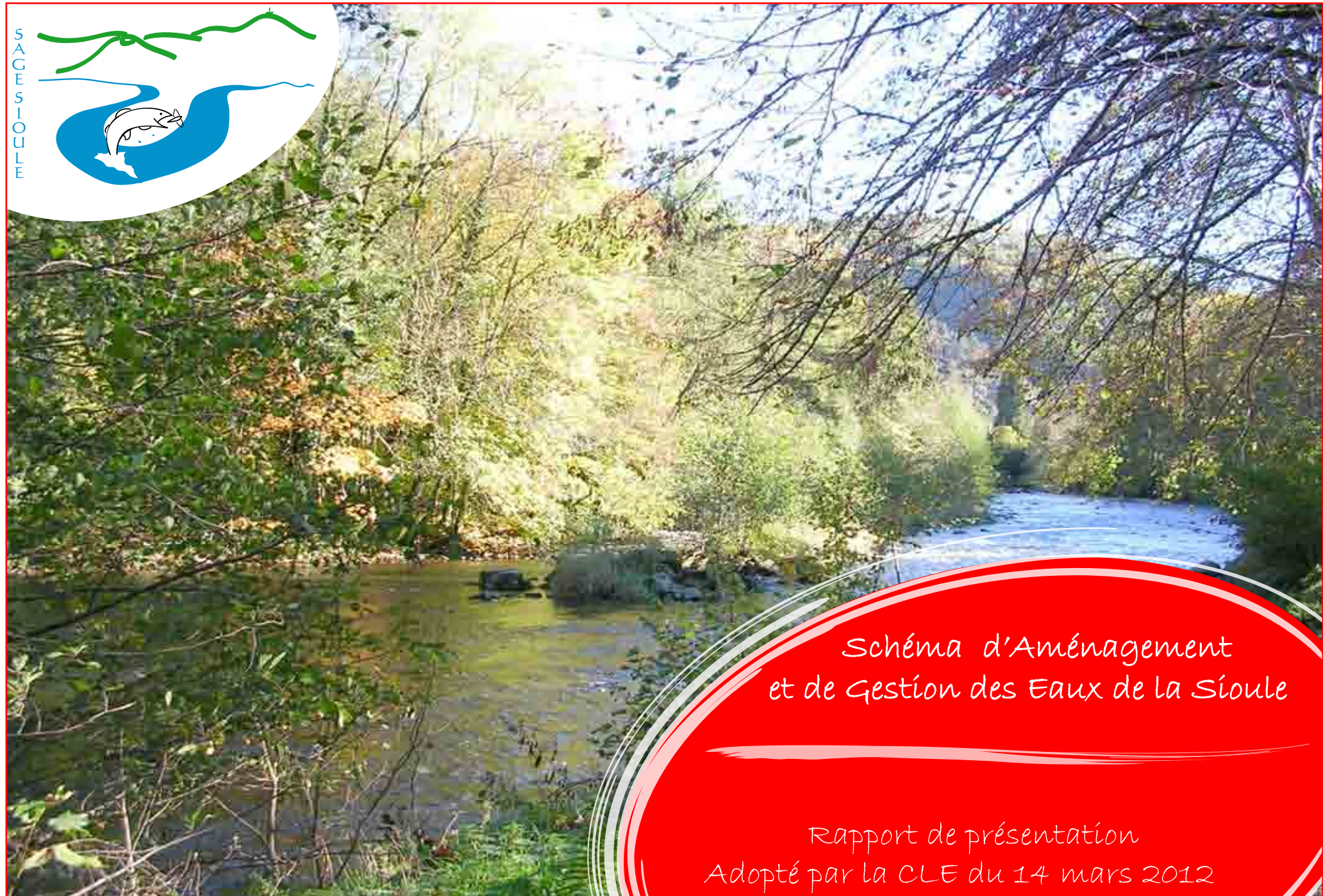
Schéma d'Aménagement et de Gestion des Eaux de la Sioule

Rapport de présentation Adopté par la CLE du 14 mars 2012