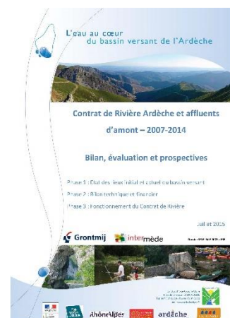
Document du bilan de contrat

Un des maîtres d'ouvrage a proposé d'inclure une étape de négociations dans l'appel d'offre. Nous avons auditionné les trois candidats dont nous avons retenu les dossiers. Cette négociation a été l'occasion de revenir sur les offres techniques, le chiffrage et de rajouter des spécificités qui manquaient aux réponses. Nous avons pu avoir un contact direct avec les chargés d'étude, échanger et les accompagner dans leur appropriation du sujet. Que ce soit avec le groupe de travail ou avec le prestataire, l'aspect relationnel a été fondamental et enrichissant.