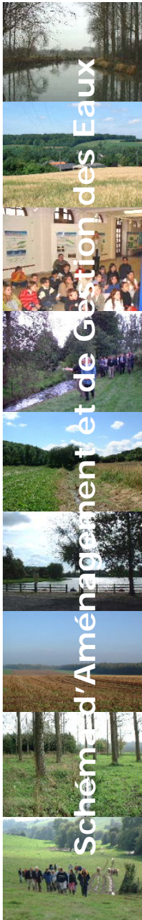
Schéma d'Aménagement et de Gestion des Eaux