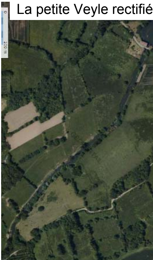
La petite Veyle rectifiée - 2005