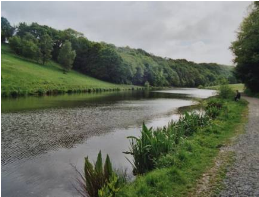
L'étang de Coupeau créé en 1969