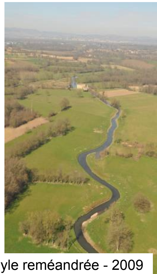
La petite Veyle reméandrée - 2009