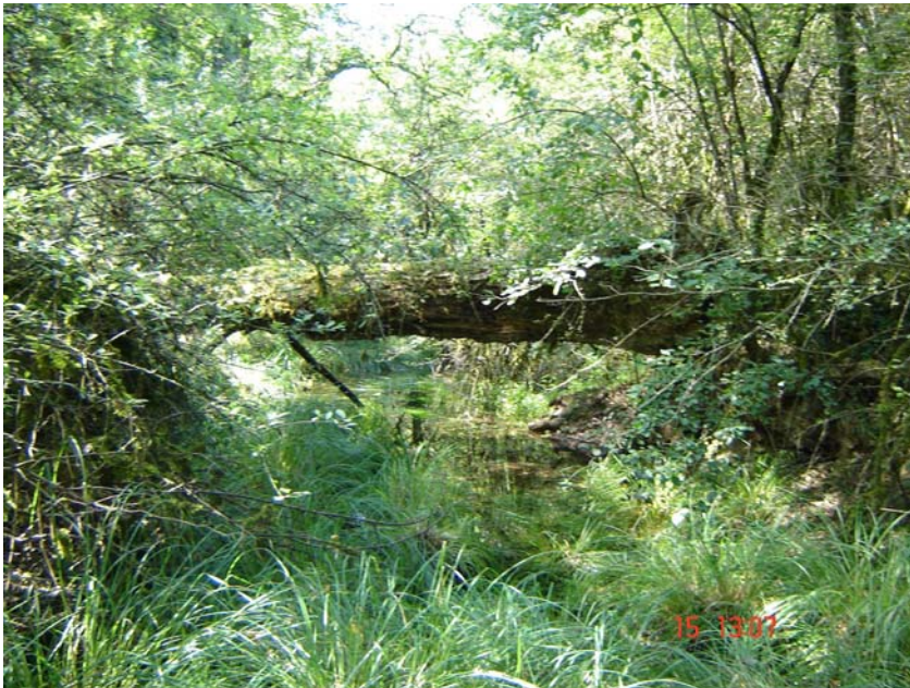
La lône de Bellegarde avant restauration