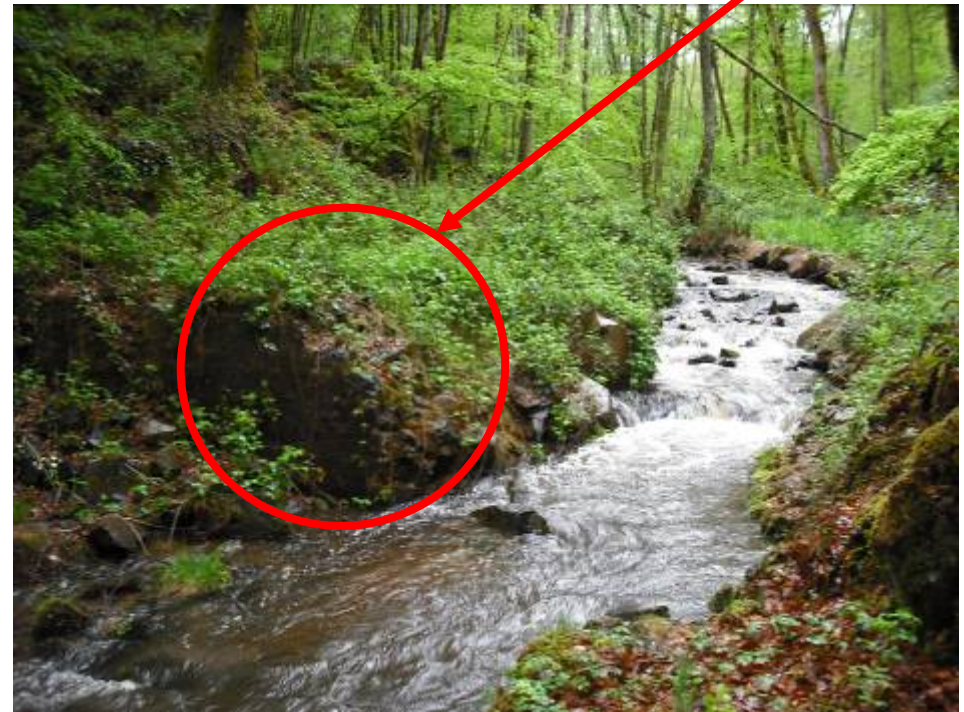
Le ruisseau de la Maria après restauration (2009)