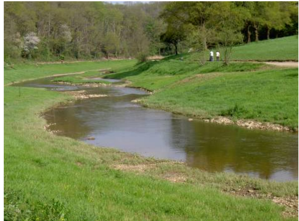
Le Vicoin après restauration (avril 2009)