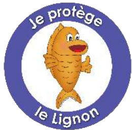
Schéma d'Aménagement et de Gestion des Eaux du Lignon du Velay

Réunion de la Commission Locale de l'Eau 7 mars 2014