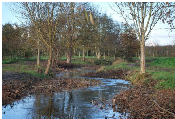
Pose de banquettes-peignes sur le Langertgraben.

Des travaux ont tout d'abord été effectués sur une petite partie du Langertgraben afin de visualiser l'amélioration des habitats et des écoulements.