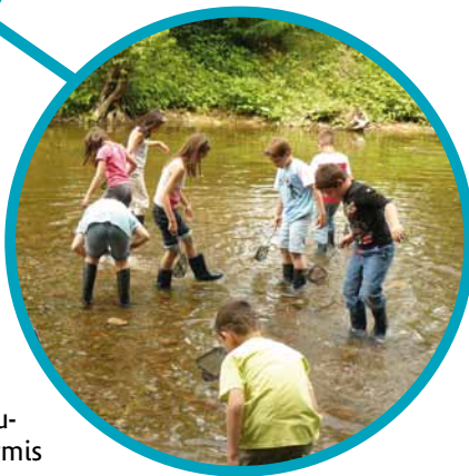
Volet C2 Sensibilisation des scolaires