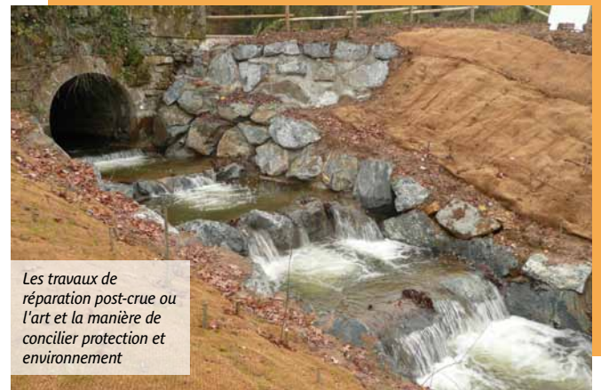
Les travaux de réparation post-crue ou l'art et la manière de concilier protection et environnement