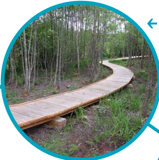
Volet B4 Sentier de découverte de la zone humide de Poule

Les Brigades de rivières ont quant à elles passé près de 10% de leur temps sur les travaux post-crués (dégagement d'embâcles, nettoyage des laisses de crues, confortement des berges érodées...).