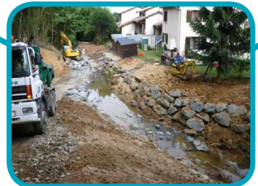
Volet B1 Protection du lotissement des Longes à Lissieu contre les crues du Sémanet