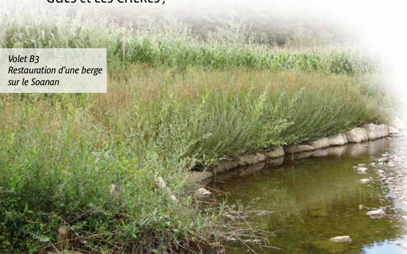
Volet B3 Restauration d'une berge sur le Soanan

L'équipe technique du syndicat anime enfin des pages dédiées à l'Azergues et au contrat de rivière sur le portail internet du Pays beaujolais.