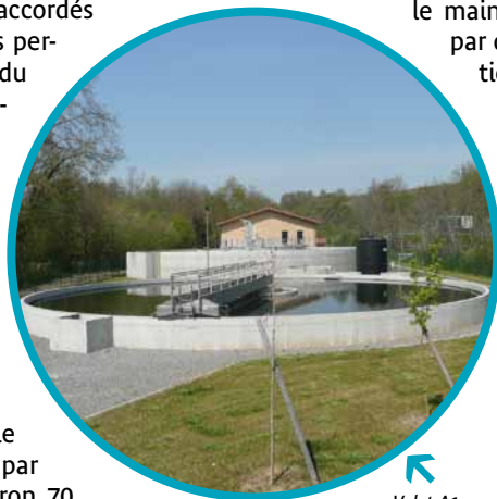
Volet A1 La station d'épuration du SAVA au Breuil

Le SMRPCA a affiné sa connaissance du fonctionnement de l'Azergues. Un plan de gestion des alluvions a été engagé, sur la base duquel des opérations d'arasement d'atterrissements gênants ont été réalisées localement, « compensées » par des actions de « ré-engravement » du lit dans les secteurs déficitaires en matériaux. D'autres actions ont été menées pour rétablir une dynamique de la rivière à la fois moins contrainte et moins dommageable pour les enjeux riverains : des confortements de seuils importants pour le maintien du profil en long, des protections de berges par des techniques végétales ou mixtes, des « renaturations » de berges remblayées ou enrochées.