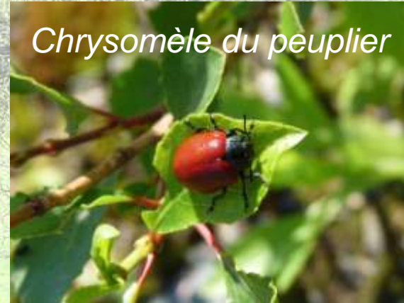
Chrysomèle du peuplier