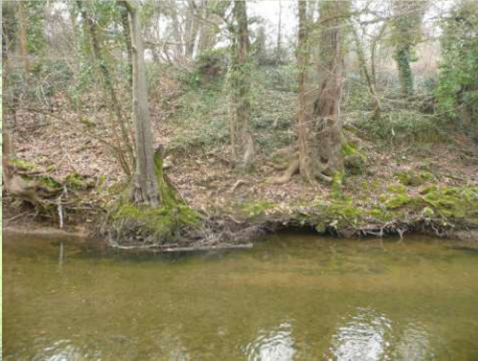
Caches en sous-berges dans système racinaire