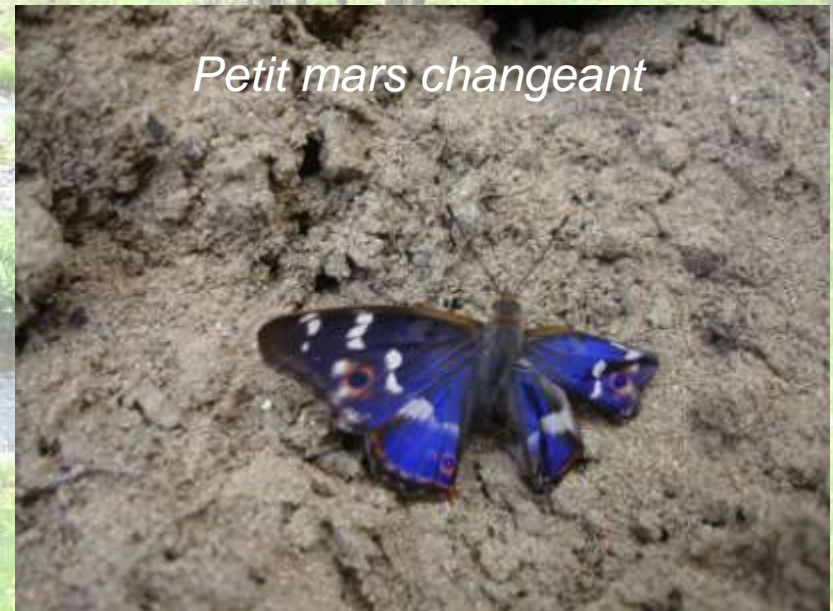
Petit mars changeant