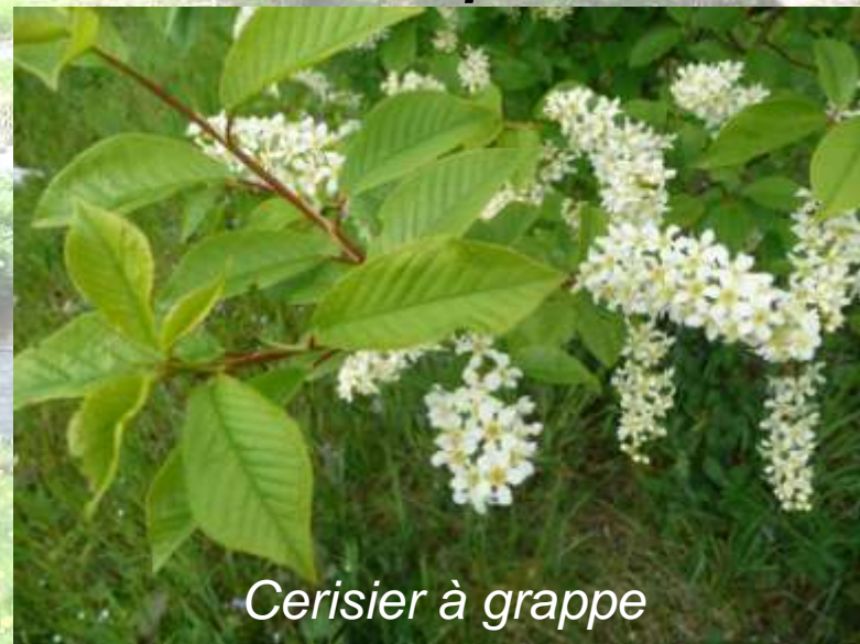
Cerisier à grappe