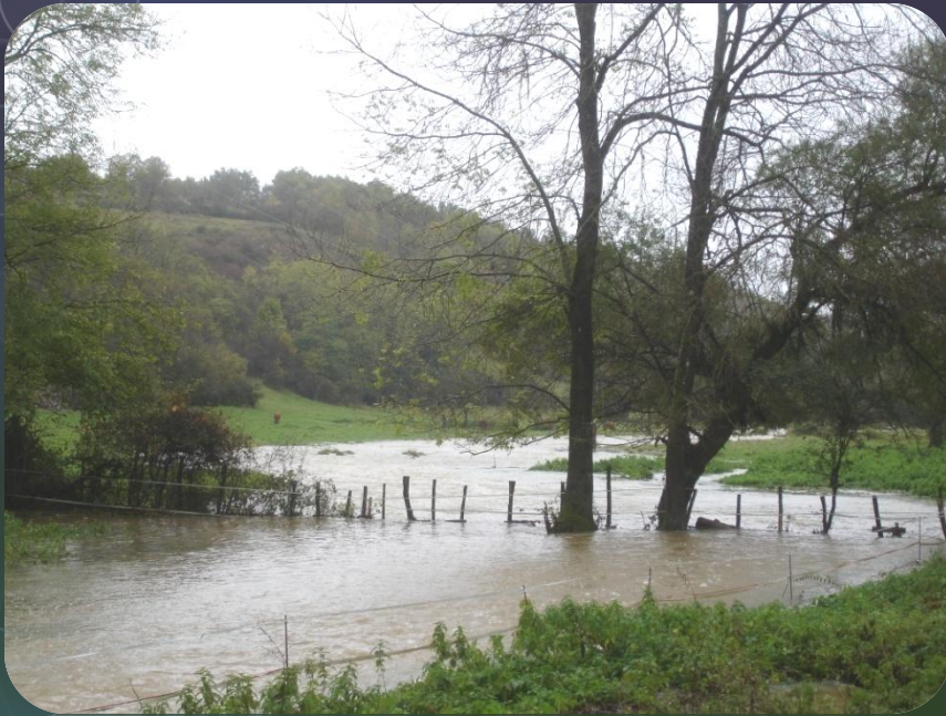
Expansion des crues