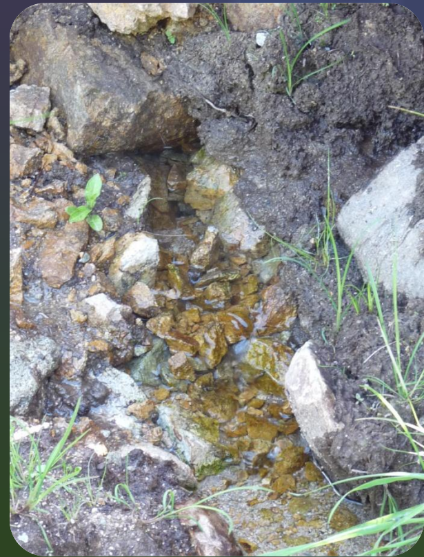
Soutien des débits d'été