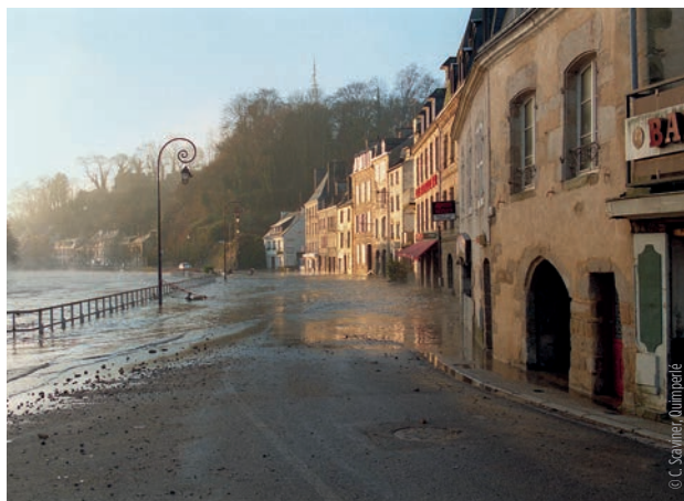
Inondation du quai Brizeux à Quimperlé, décembre 2000

L'hiver arrive et avec lui, la vigilance face aux éventuelles inondations grandit sur Quimperlé et les entreprises situées en bord de rivières. Alors que majoritairement, c'est l'aval qui est touché, il est nécessaire d'opérer à l'échelle du bassin versant tout entier pour lutter efficacement contre les inondations.