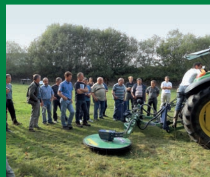
Rencontre à S t Tugdual, le 26 septembre