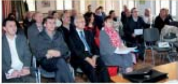
CLE du 14 janvier 2014

Approbation du projet de SAGE et mise à la consultation.