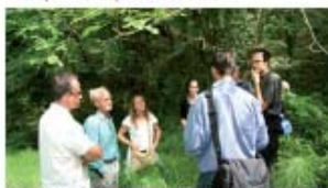
Atelier terrain "milieux naturels" : lecture de l'évolution du paysage dans la plaine de Bonnieux-Lacoste, découverte du patrimoine bâti lié à l'eau et présentation de zones humides et de leurs rôles fonctionnels.

Rédaction des pré-dispositions du SAGE par l'animateur du SAGE avec l'aide des bureaux d'études