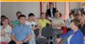
CLE du 3 juillet 2013

Poursuite de la concertation pour affiner et valider successivement et thématiquement le SAGE