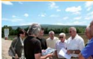
Atelier terrain "Risque" : lecture du risque inondation à travers la cartographie et la réalité de terrain, les risques liés au pluvial sur Cavalion.

Co construction pour l'écriture du nouveau SAGE.