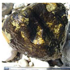
Biofilm à cyanobactéries