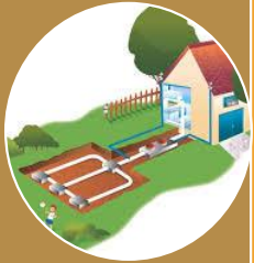
Masses d'eau Littorales Sud Atlantique