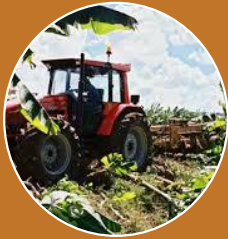
Masses d'eau Littorales de la Baie de Génipa