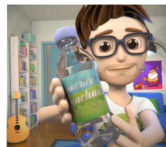
Figure 1: "Dorian et le changement climatique", vidéo YouTube

Lien de la vidéo YouTube : https://youtu.be/K3JkwWIC_2A