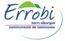
Schéma d'Aménagement et de Gestion des Eaux SAGE Côtiers basques