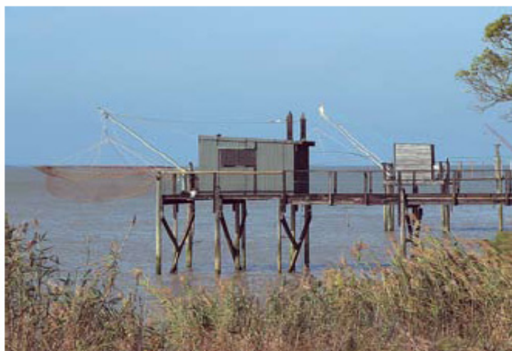
SCHÉMA D'AMÉNAGEMENT ET DE GESTION DES EAUX « ESTUAIRE DE LA GIRONDE ET MILIEUX ASSOCIÉS »