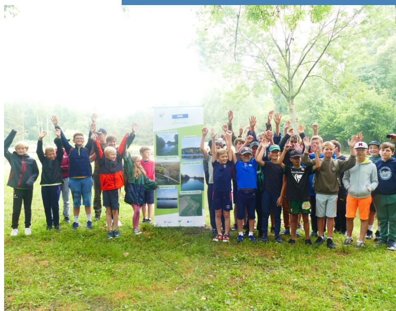
Les jeunes de l'Arleusienne