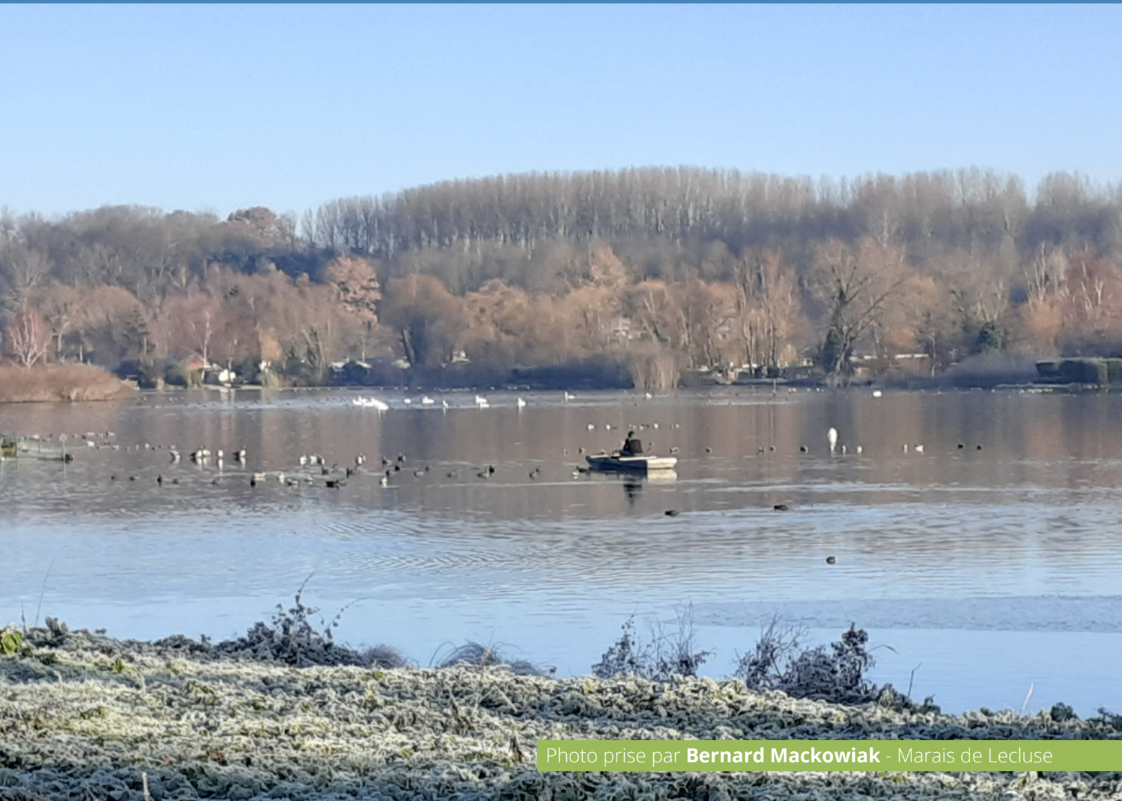
Marais de Lecluse