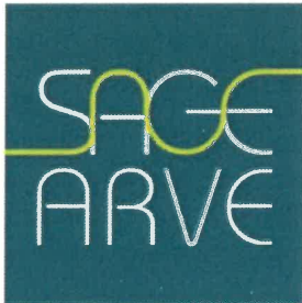
Schéma d'Aménagement de Gestion des Eaux du bassin de l'Arve