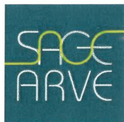
Schéma d'Aménagement de Gestion des Eaux du bassin de l'Arve

Les moyens humains et financiers ainsi que le planning prévisionnel de mise en œuvre du SAGE sont détaillés dans la partie 5 du Plan d'Aménagement et de Gestion Durable de la ressource en eau et des milieux aquatiques.