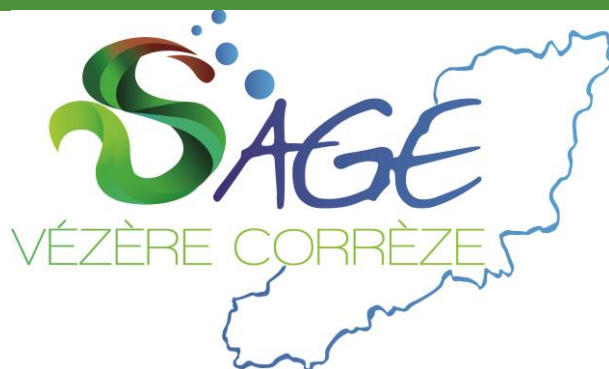
SCHÉMA D'AMÉNAGEMENT ET DE GESTION DES EAUX DU BASSIN VERSANT VÈZÈRE-CORRÈZE