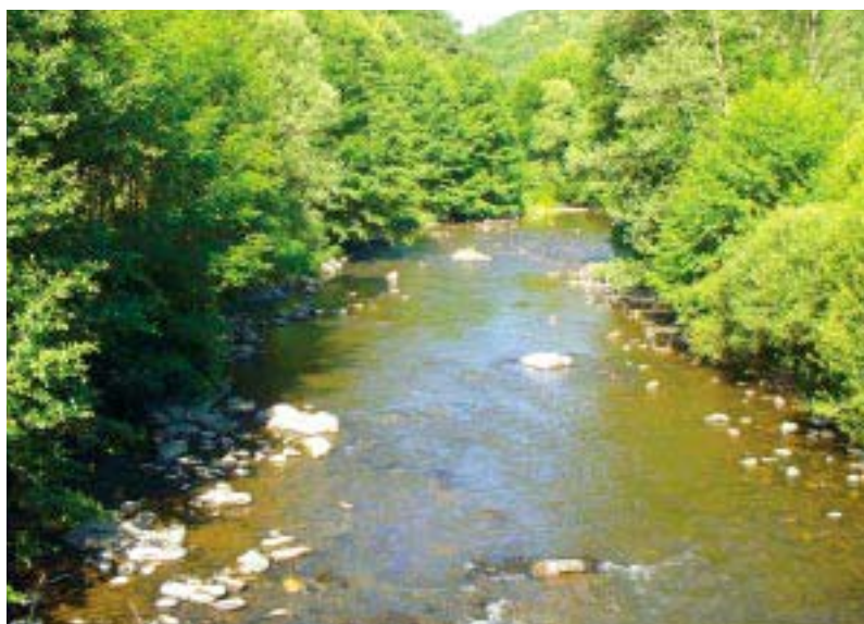
Cours de l'Alagnon - Cantal

Un programme d'actions a été établi, avec un premier enjeu qui est celui de la reconquête de la rivière par les migrateurs, qui vaut au contrat de rivière le surnom évocateur de "Contrat Saumon".