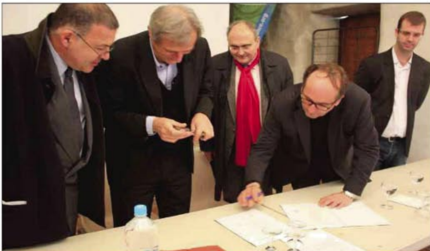
Le premier contrat de rivière a été signé dernièrement à Galéria.

* Le Fango, les ruisseaux de Canne, Cavichja, Marsolinu, Pericatu, Palazzu - sud Nonza.