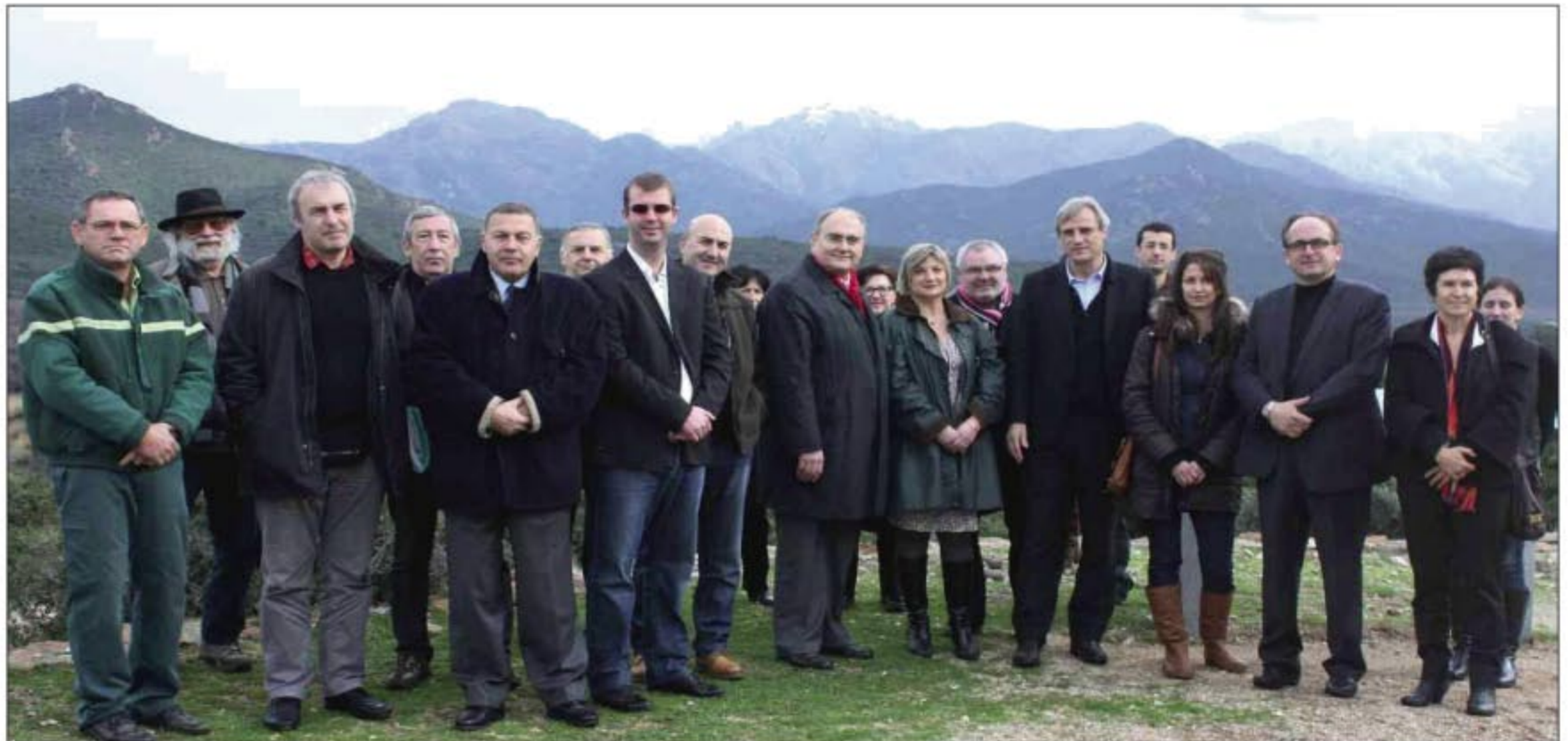
Premier du genre en Corse, le contrat de rivière du Fango en Balagne instaurera un plan d'action pendant cinq ans pour préserver et améliorer la qualité des ressources d'eau.

D'autres facteurs d'inquiétude rentrent aussi en ligne de compte : ressources limitées et vulnérables, eau distribuée de