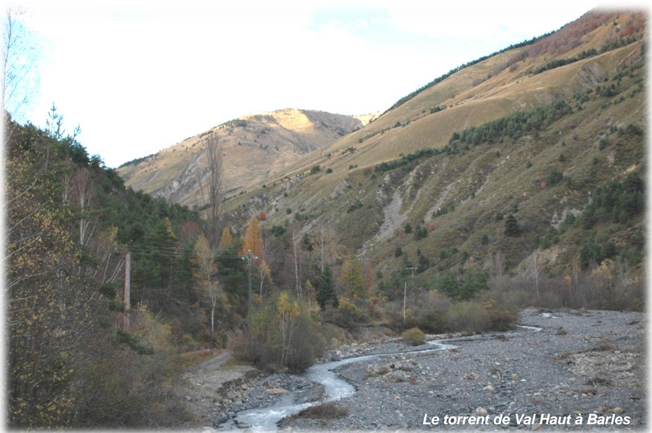
Le torrent de Val Haut à Barles