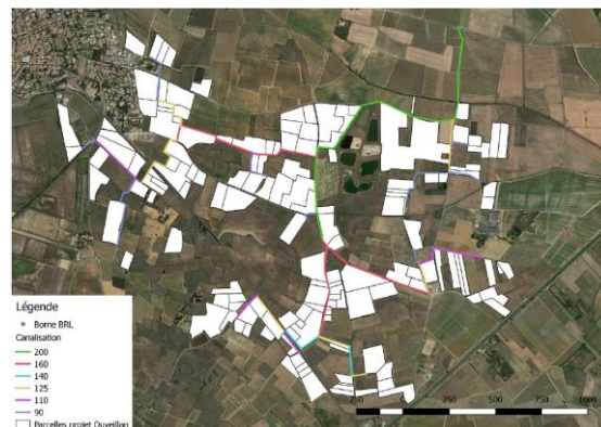
Figure 3 : Localisation du projet d'extension de réseau sur la commune d'Ouveillan

Le projet concerne au total 116 hectares pour un usage strictement agricole. Cet filot est situé à proximité du réseau hydraulique régional actuel, localisé au nord du projet. Le réseau projeté est composé de près de 11 km de réseaux alimentant 65 bornes agricoles.