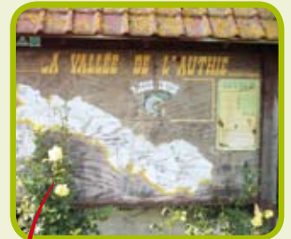
Panneau de Willencourt La pêche : un loisir traditionnel sur l'Authie