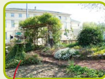
Aménagement en vivaces à Beauvais

La Charte régionale d'entretien des espaces publics fixe des objectifs à atteindre et décline les actions que