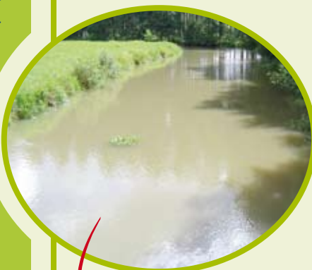
L'Authie après un épisode pluvieux Les conséquences de l'érosion des sols