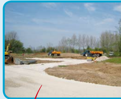
Travaux de construction de la nouvelle station d'épuration d'Auxi-le-Château qui ont démarré début avril

Concernant l'assainissement non collectif, la Communauté de Communes de l'Hesdinois a décidé la création de son Service Public de l'Assainissement Non Collectif (SPANC). Pour les secteurs éligibles aux aides financières de l'Agence de l'Eau, les particuliers pourront, sous certaines conditions,