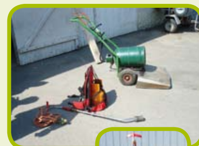
Le désherbeur thermique : l'une des alternatives aux produits chimiques