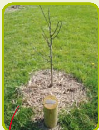
Le paillage empêche la levée des plantes indésirables.

Pour généraliser ces bonnes pratiques et inciter les communes, les intercommunalités et les collectivités gestionnaires d'espaces publics à s'inscrire progressivement