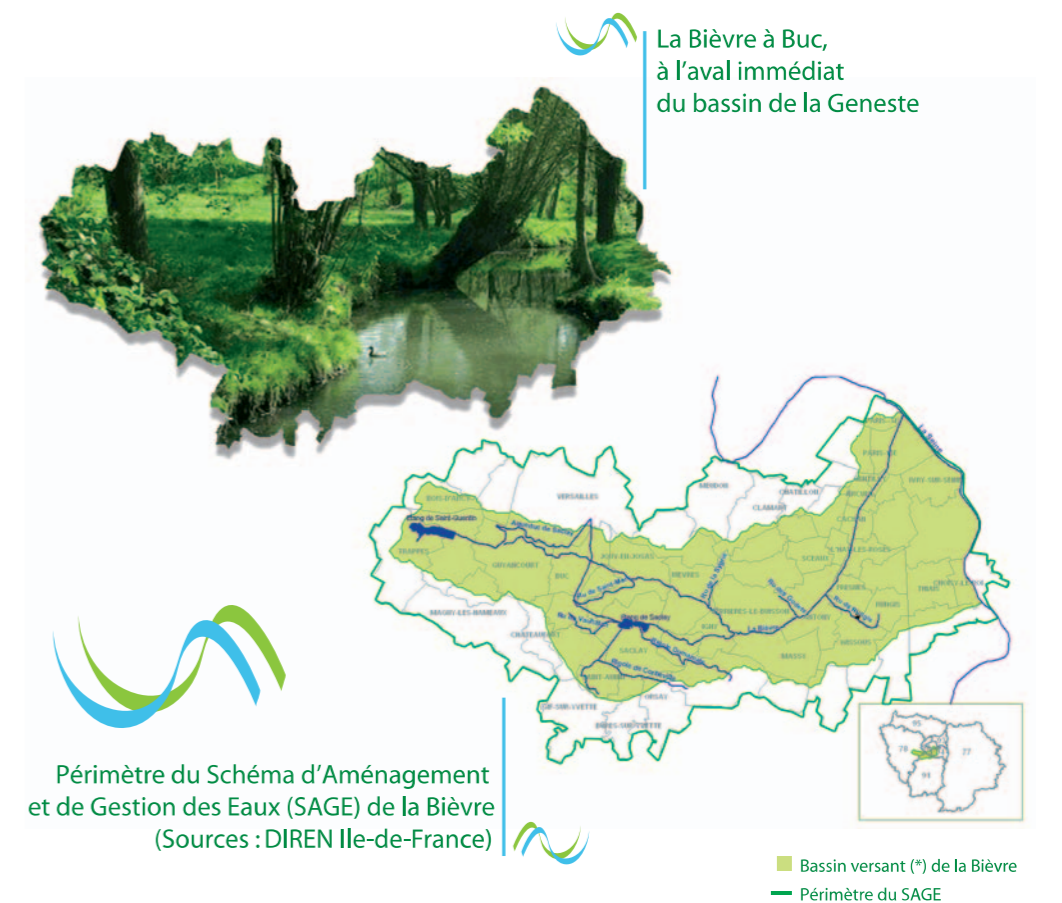
La Bièvre à Buc, à l'aval immédiat du bassin de la Geneste