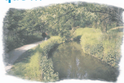
La Bièvre à Igny