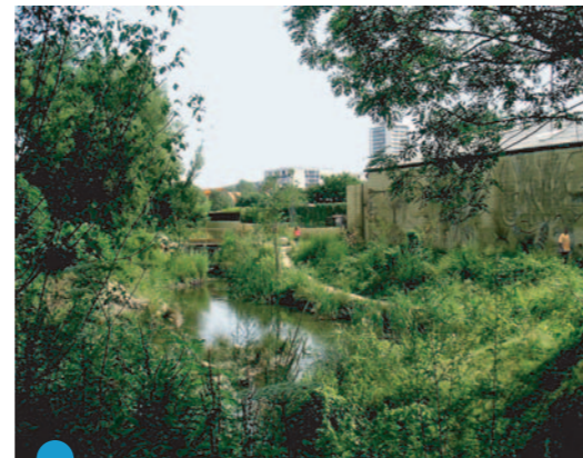
La Bièvre ré ouverte sur 300 m au Parc des Prés à Fresnes par la Communauté d'Agglomération de Val de Bièvre (CAVB)