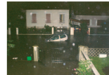
Le SAGE : un moyen de maîtriser les eaux de ruissellement collectées sur l'ensemble du bassin versant de la Bièvre (ici les inondations à Fresnes le 7 juillet 2001)

Moulin de la Bièvre 73, avenue Larroumès 94240 L'Haj-les-Roses Tél. : 01 49 73 38 71 Fax : 01 49 73 75 02 Email : sagebièvre@wanadoo.fr