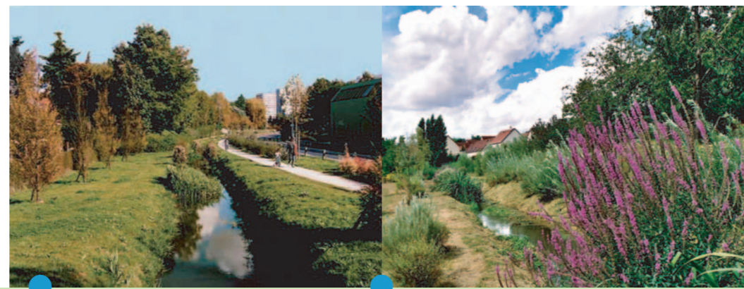
La Bièvre redécouverte sur 1,2 km entre Verrières-le-Buisson et Massy en 2000 par le Syndicat Intercommunal d'Assainissement de la Vallée de la Bièvre (SIAVB)

Réouvrir la Bièvre partout où cela est possible