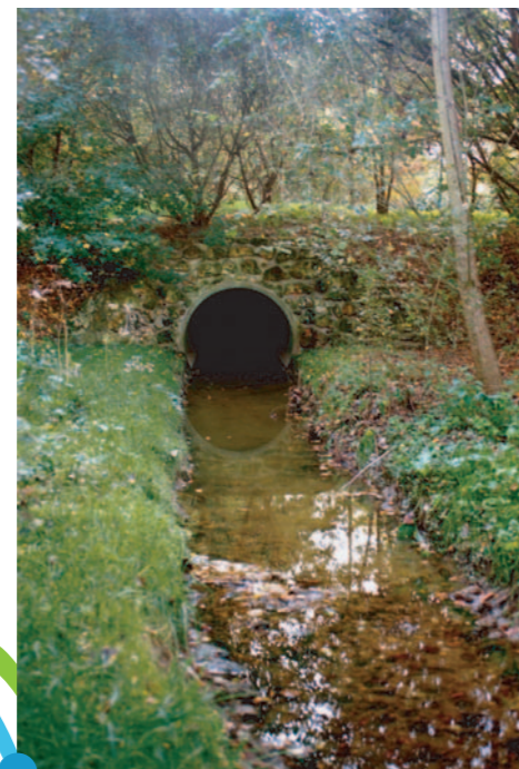
Zone des sources de la Bièvre