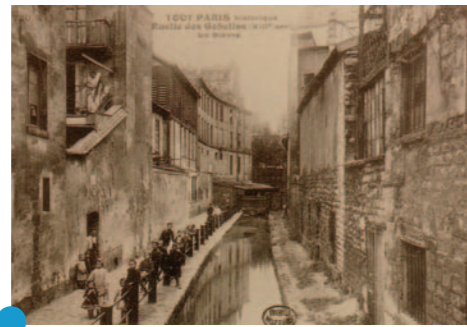
Tout Paris historique Ruelle des Gobelins (XIIIème arrt), la Bièvre