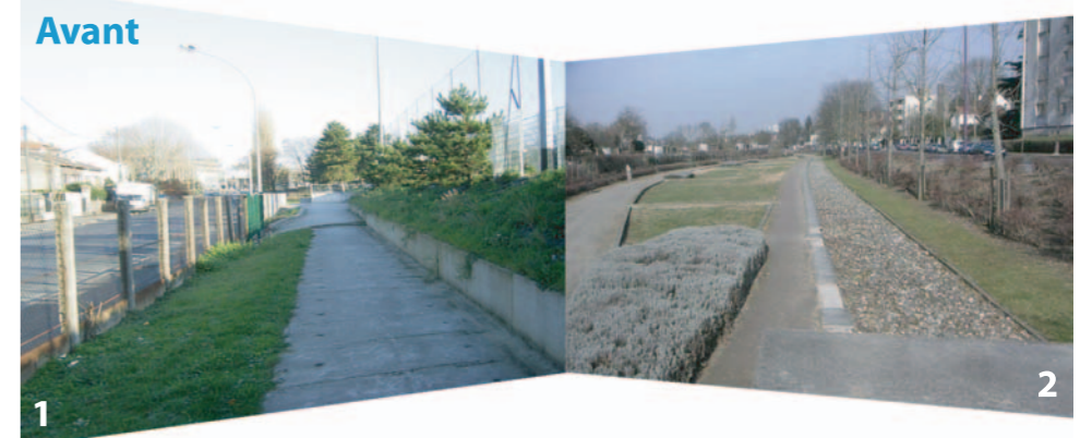
1 Avenue François Raspail au Parc du Coteau à Arcueil - Gentilly 2 Avenue Flouquet à L'Haÿ-Les-Roses

Deux projets de réouverture de la Bièvre du Département du Val-de-Marne verront également bientôt le jour... Les travaux sont prévus en 2012-2015 : 610 m au Parc du Coteau à Arcueil – Gentilly et 650 m Avenue Flouquet à L'Haÿ-Les-Roses.