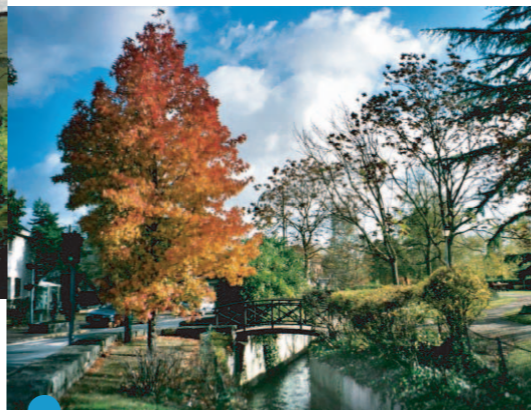
La Bièvre à Jouy-en-Josas