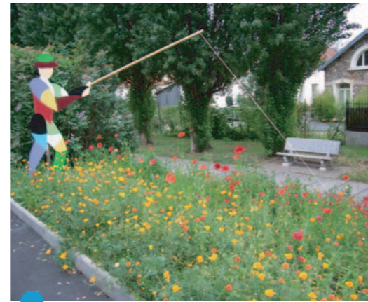
La Bièvre couverte à Arcueil (Av. de la Convention)