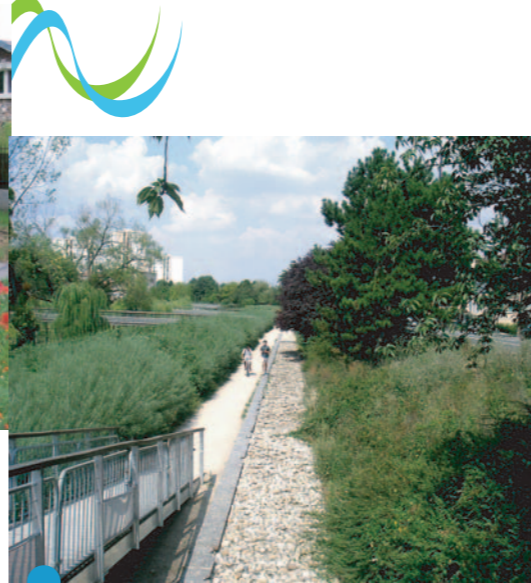
La Bièvre couverte à L'Haÿ-Les-Roses